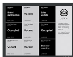
Siatka dostępności sali konferencyjnych