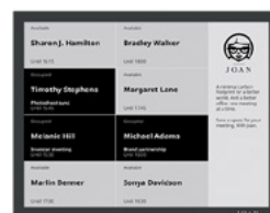
Siatka dostępności zespołu

Wykorzystaj Joan 13 do wyświetlania statusu pojedynczego pomieszczenia, wraz ze szczegółami dotyczącymi wydarzeń, lub wyświetlaj dostępność współpracowników lub pomieszczeń – nawet do dziewięciu jednocześnie!