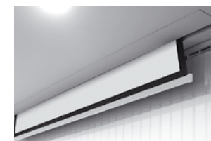
Idealny do montażu sufitowego lub ściennego