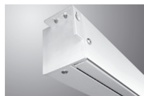
Kwadratowy przekrój obudowy